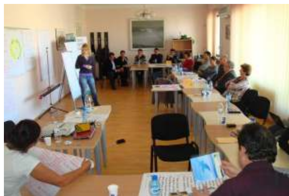
1. Михаела от „Габи тур“ представя работата на групата „Разработване на регионални проекти“

Участие взеха и партньорските НПО организации по проекта от България.